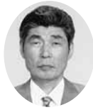
常議員 常議員 ㈱菅野寛商店 代表取締役