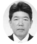
常議員 常議員 アイワビルド㈱ 代表取締役