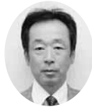
常議員 常議員 ㈱アサヒビルメンテナンス 代表取締役