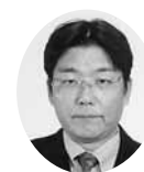
常議員 常議員 ㈱中村環境 代表取締役