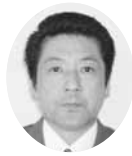
常議員 常議員 ㈱晴風荘 常務取締役