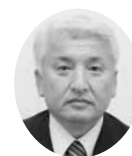
常議員 常議員 ㈱米山商事 代表取締役