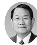
常議員 常議員 ㈱立谷商会 代表取締役会長