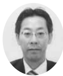
常議員 常議員 東北電力㈱相双営業所 総務課長