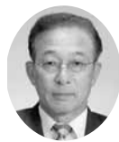
常議員 常議員 工業部会長 ㈱東部タンポール工業 代表取締役