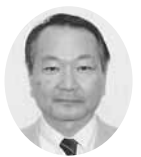
常議員 常議員 ㈱只野商事 代表取締役