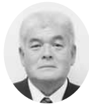
常議員 常議員 建設業部会長 ㈱石匠松もと 代表取締役