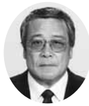
副会頭 副会頭 旭電設工業㈱ 代表取締役