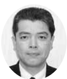
監事 監事 相双信用組合 本店長