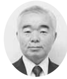
常議員 常議員 アクサ生命保険㈱ 相双営業所長