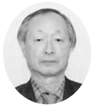
常議員 常議員 地域開発委員長 小松製粉製麵所 代表