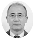
常議員 常議員 相馬環境サービス㈱ 取締役総務部長