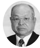
名誉会頭 名譽会頭 ㈱オアシス楽器店 会長