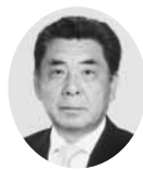
常議員 常議員 だてや 代表