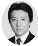
常議員 常議員 小野建設㈱ 代表取締役