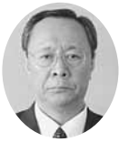
常議員 常議員 相馬共同火力発電㈱ 取締役副社長