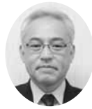
常議員 常議員 ㈱七十七銀行相馬支店 支店長