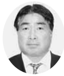
副会頭 副会頭 ㈱サンエイ海苔 代表取締役社長