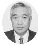
会 頭 会頭 ㈱アライリースサービス 代表取締役