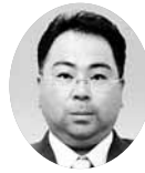
常議員 常議員 ㈱佐伯不動産 取締役社長