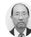
常議員 常議員 ㈱ハイカラ屋商店 代表社員