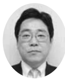
常議員 常議員 サービス業部会長 ㈱東邦銀行相馬支店 支店長