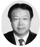
常議員 常議員 まちづくり委員長 ㈱キクチ 代表取締役