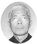
常議員 常議員 ㈱鳥久精肉店 代表取締役会長