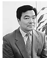
高橋 進／たかはし・すすむ

1953年生まれ。一橋大学経済学部卒業後、76年住友銀行に入行。ロンドン駐在、経済調査部などを経て、90年日本総合研究所に着任。2000年から04年まで早稲田大学大学院アジア太平洋研究科客員教授、03年から近畿大学経済学部・経営学部客員教授を務める。13年1月、政府・経済財政諮問会議の民間議員に就任。現在、テレビのコメンテーターとしても活躍中。著書『10年後の日本を読む「先見力」のつけ方』（徳間書店）のほか、日本経済新聞、産経新聞などに多数執筆。