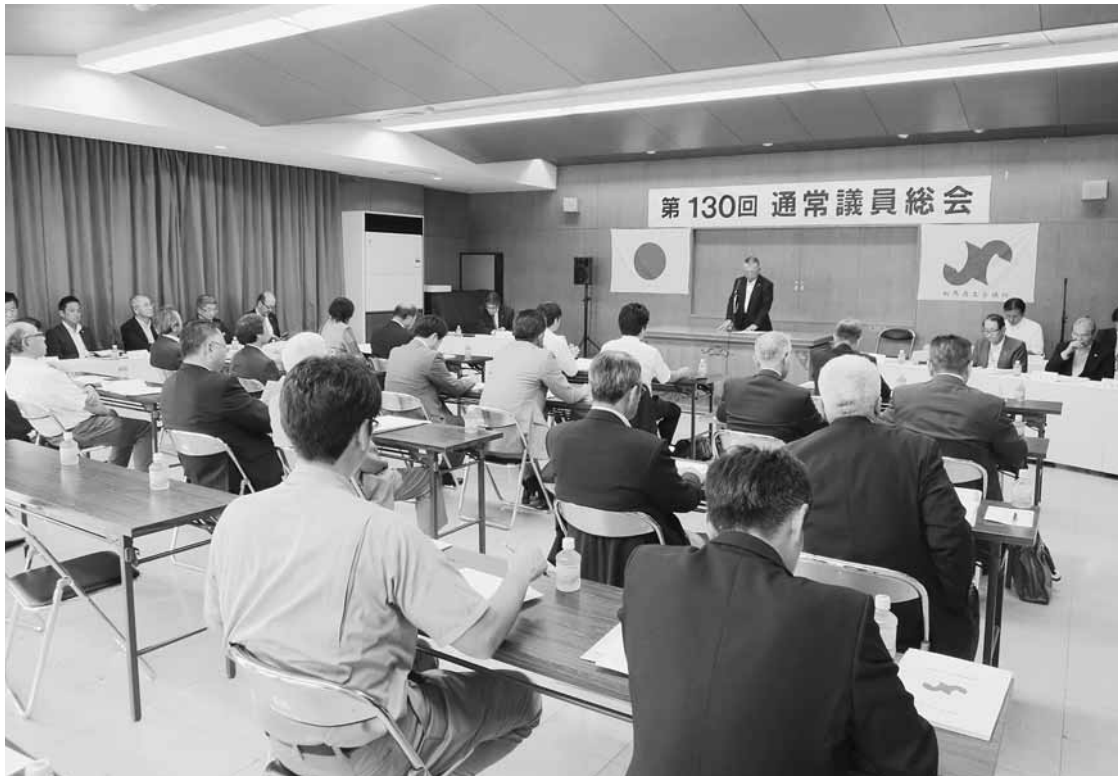
議員各位への感謝を述べる新妻会頭（中央）

商工会議所は、その地区内における商工業の総合的な改善発達を図り、兼ねて社会一般の福祉の増進に資することを目的とする。