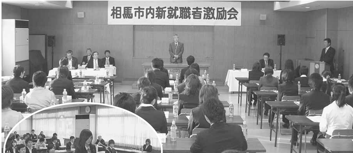
相馬市内新就職者激励会

商工会議所は、その地区内における商工業の総合的な改善発達を図り、兼ねて社会一般の福祉の増進に資することを目的とする。