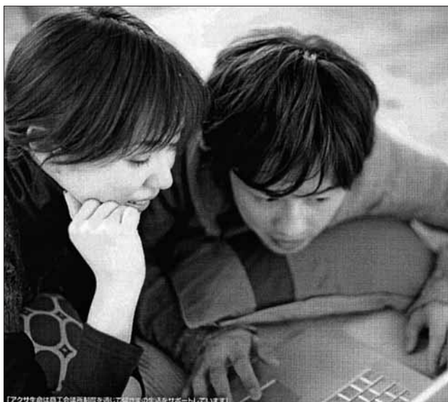
「アクサ生命は商工会議所制度を通じて皆さんの生活をサポートしています」