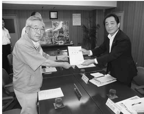
日商宮城常務へ要望書を手渡す荒井会頭