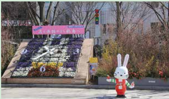
▲写真はイメージです。

春の観光シーズンに合わせて、福島市を訪れる観光客の皆さまを今年も「花」でお出迎えいたします！ JR 福島 駅東口駅前広場の花時計周辺に「ミニ花見山」を設置するほか、古関裕而ストリート（駅前通り・レンガ通り）には「花ももの木のプランター」や「切り花」を設置して街行く人に春をお届けします。期間中、福島駅周辺では、「ハルフェス 2024」をはじめとしてイベントを開催いたします。春爛漫の福島へぜひお越しください。お待ちしております