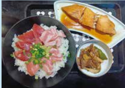
味噌汁が付きます。

当店は、松川浦で水揚げされた新鮮な魚介類をメインとした料理とお酒を提供する居酒屋です。新鮮な地元の魚介類を多くの人に食べてもらおうと8年前に、居酒屋の営業を始めました。今年の5月からは、ランチ営業を始めましたので、お昼に新鮮な魚介類を是非当店で味わってください。