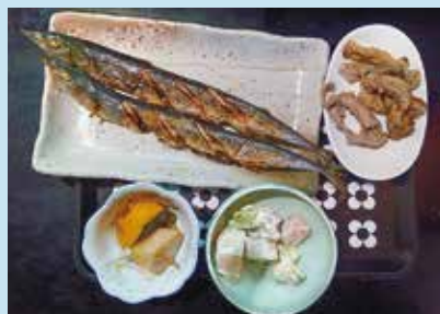
ご飯と味噌汁が付きます。