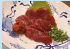
会津直送 生馬刺し