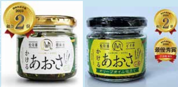
松川浦かけるあおさ

「松川浦かけるあおさ」は、松川浦の名産乾燥あおさをごまやフライドガーリックで漬けた万能調味料です。程よい辛さが特徴の「ピリ辛松川浦かけるあおさ」は、洋風の味付けにも最適です。ご飯やパン、パスタや冷奴にも! 万能調味料を是非ご賞味ください。