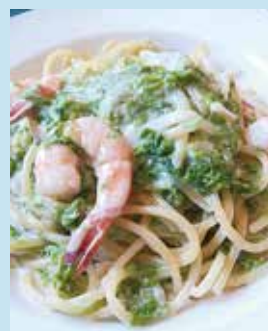
青のり小エビの クリームパスタ

ランチメニュー ・サラダ、スープ、パスタ、 ドリンク付き（ドリア、チ キンの煮込みランチもあり）