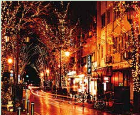
【写真】 光のしずくフォトコンテスト2023金賞「街の明かりがとてきれいな〜」

2007年より開催している福島市の冬の風物詩「光のしずくイルミネーション」が今年も開催されます。