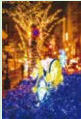
【写真】 光のしずくフォトコンテスト2023銀賞「光の海」