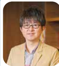
気象予報士兼税理士

「会社防災タイムライン」は災害時の経営面での事業継続計画に、災害発生前の予測を加味することで被害を軽減できます。また、事前準備を重視しておりますので、早期の復旧にもつながります。被災した地域では、企業の復旧が励みになります。日常に戻った証しにもなり、地域の雇用を守ることもできます。会社は事業の継続が使命でもありますので、この考え方が全国に広まって多くの会社の役に立つとうれしいです。