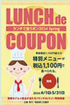
▲画像は前回春のパンフレット