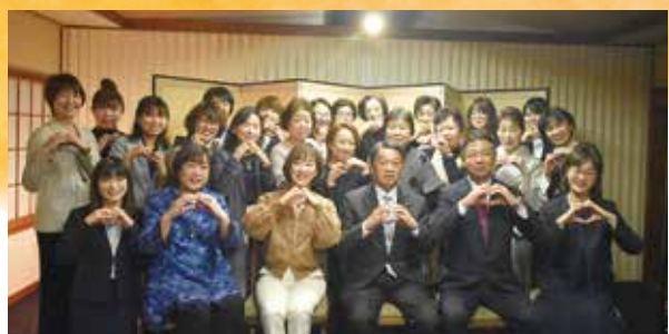
相馬商工会議所女性会 事務局 荒 ☎36-3171