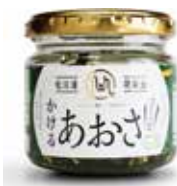
松川浦かけるあおさ

「松川浦かけるあおさ」シリーズは、浜の駅松川浦や道の駅そうま、県観光物産館などで購入できる。