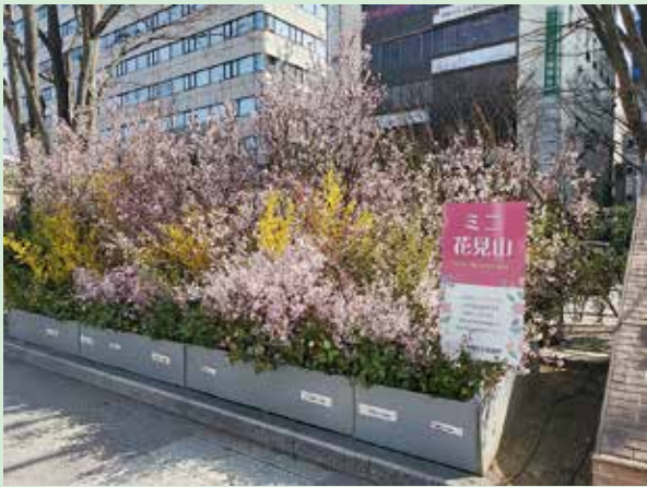
▲写真は昨年の様子

期間中、1,100 円超のランチを 1,100 円（税込）でご飲食できる「ランチで食うポン」も開催します。ふくしまプレ DC（デスティネーション）特別企画として 4～6 月の 3 か月間開催しますので、「花」と合せて福島の「食」もお楽しみください！