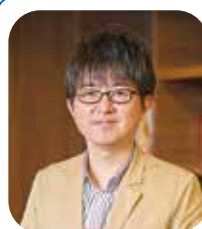
気象予報士兼税理士

「暑さ寒さも彼岸まで」といいますが、9月でも猛暑日が続くという夏が長い時代になりました。今後は災害級の猛暑に備えて対策をしつつ、売り上げを上げるチャンスと捉え、これまでの夏とは全く異なったイメージで、早めに取り組んでみてはいかがでしょうか。