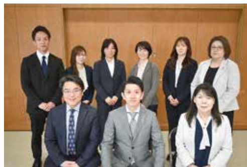
アクサ生命保険(株)相双営業所 相馬分室