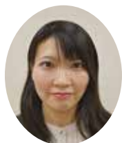
中小企業相談所 補助員 指導課書記