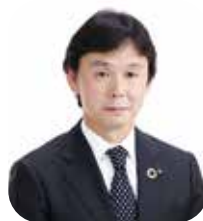
株式会社大和総研 金融調査部 主席研究員

最後に、本稿のテーマである「どうすれば地方自治体のガバナンスを強化できるか」に対する答えは、当然ながら全ての住民が社会規範と責任を持って主体的に地域の運営、ガバナンスに関与することであり、それ以外の答えはないのではない。