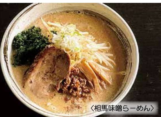
〈相馬味噌らーめん〉