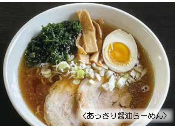
〈あっさり醤油らーめん〉